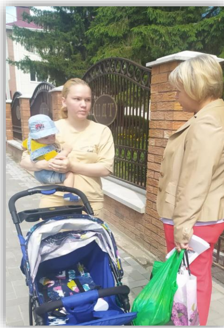
Консультация молодой мамы специалистом по социальной работе ОКУ «Центр сопровождения», осуществляющим деятельность в Дмитриевском районе Курской области

Проект «Подарок Аиста» получил большой отклик, несовершеннолетние мамы получают квалифицированную социальную, педагогическую, медицинскую, психологическую, юридическую помощь. Но более всего ценна всесторонняя систематическая поддержка от специалиста-наставника несовершеннолетней матери, который, находясь рядом, всегда готов к оказанию помощи, передаче своего опыта, быстрейшему отклику на просьбу о помощи во всех возникающих проблемных ситуациях.