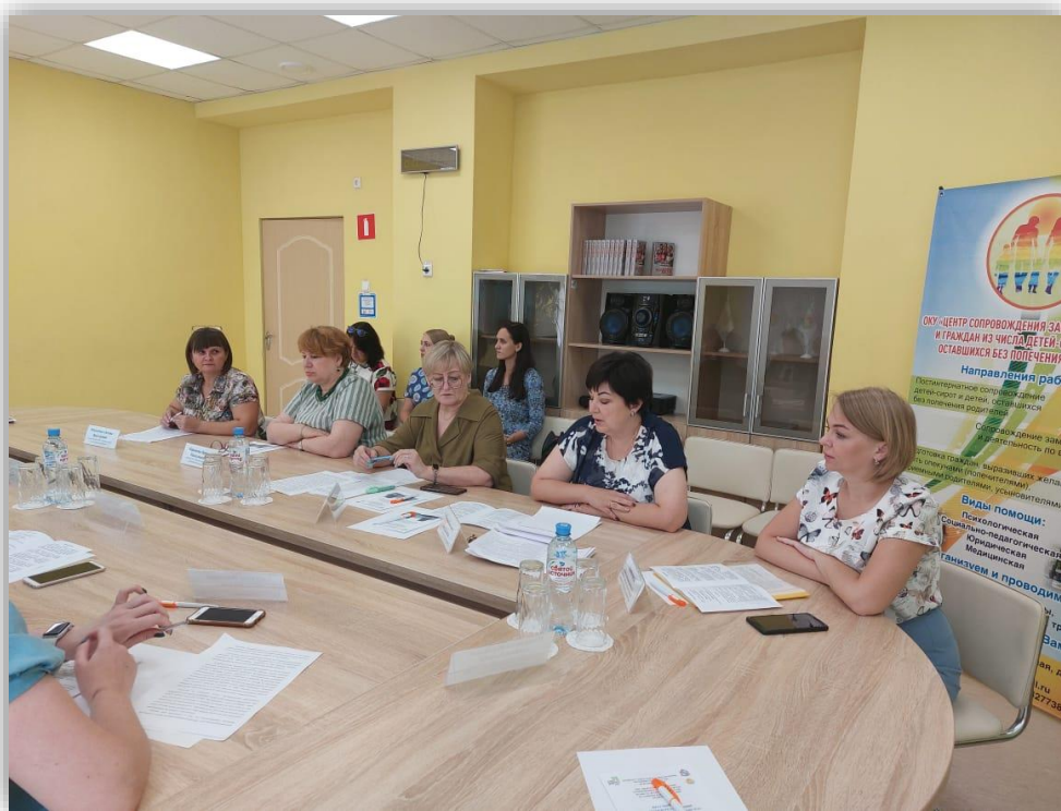
Круглый стол по итогам реализации проекта «Подарок Аиста»

Работа ОКУ «Центр сопровождения» в качестве опорной площадки после реализации Проекта продолжается, накопленный опыт по сопровождению несовершеннолетних беременных (матерей), их близкого окружения, разработанные инновационные технологии, доказавшие свою эффективность, транслируются на мероприятиях регионального и Всероссийского уровней.