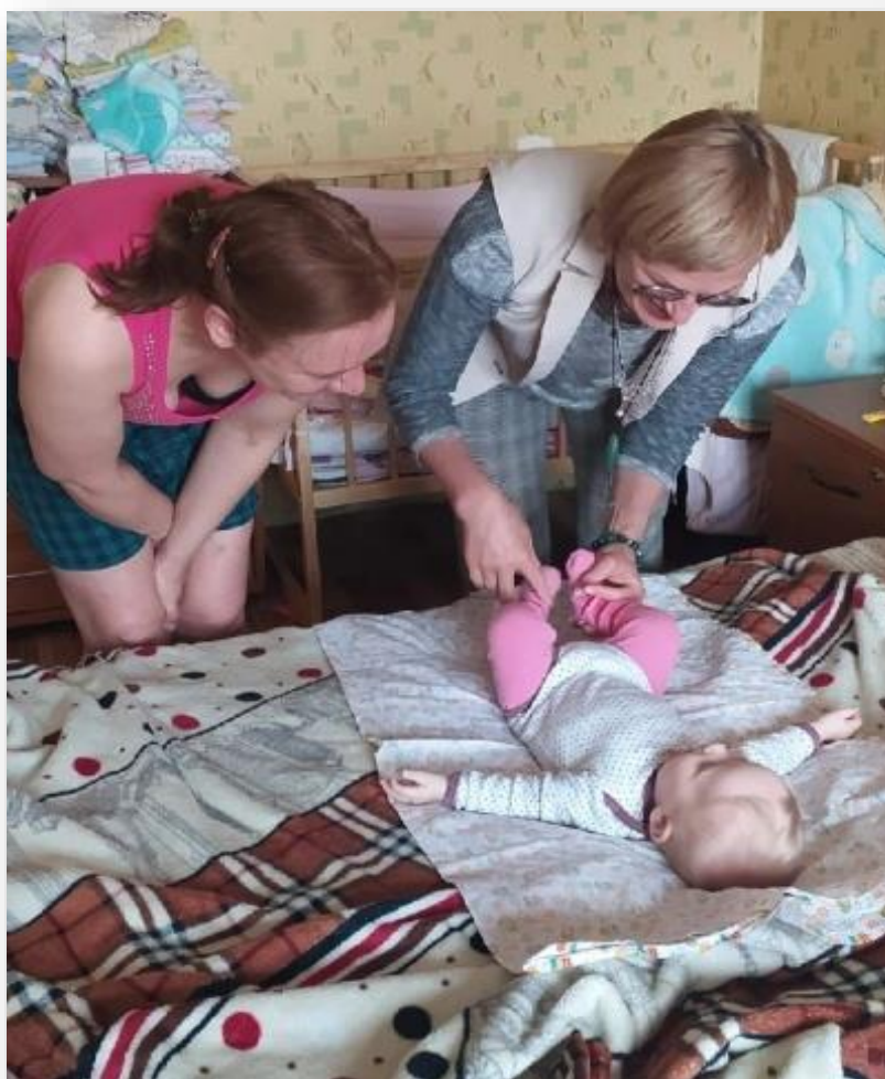
Консультация молодой мамы специалистом по социальной работе ОКУ «Центр сопровождения», осуществляющим деятельность в городе Железногорске Курской области

Мероприятия, проводимые специалистами ОКУ «Центр сопровождения», направлены на формирование у молодых мам навыков защиты своих прав, организацию и проведение развивающих и досуговых мероприятий для детей, ведение здоровьесберегающего образа жизни, обучение навыкам, необходимым для повышения конкурентоспособности на рынке труда, самообеспечения и самообслуживания.