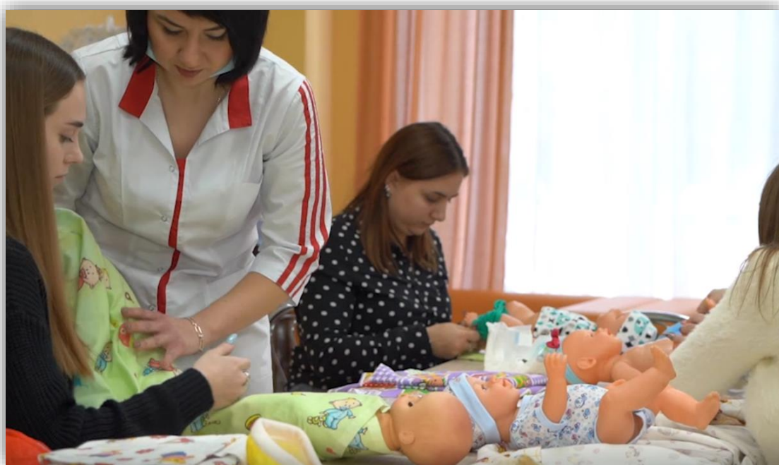
Занятия по программе «Школа молодой мамы» в ОКУ «Центр сопровождения»

За период 2021-2022 года занятия в «Школе молодой мамы» посещали 15 несовершеннолетних беременных. И постоянная помощь и поддержка педагогами-психологами, социальными педагогами и другими специалистами, задействованными в программе «Школа молодой мамы», объясняют успехи в социальной адаптации несовершеннолетних мам, профилактике социального деструктивного поведения, повышении родительских компетенций.