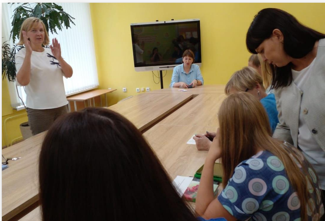
Семинар-совещание для специалистов по юридическим вопросам о соблюдении законодательства в отношении несовершеннолетних беременных и мам

В законодательной практике не разработаны специальные нормативно-правовые акты, касающиеся вопросов несовершеннолетнего материнства. При этом, специфика положения несовершеннолетней матери однозначна, следовательно, и правовая защищенность несовершеннолетнего материнства должна обладать специфическими характеристиками. На наш взгляд, необходимо предоставлять дополнительные блага и гарантии несовершеннолетней матери, учитывая сложившуюся у нее жизненную ситуацию, материальное положение и социальный статус.