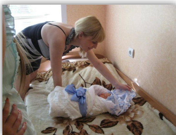
Оказание помощи несовершеннолетним беременным и молодым мамам на базе МБУ СОН «Социальная гостиная» г. Курска