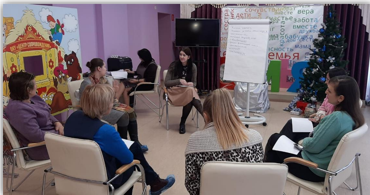
Тренинг на занятиях по программе «Наставник+»

Мероприятия по программе «Наставник+» направлены на формирование у молодых мам навыков защиты своих прав, организации и проведения развивающих и досуговых мероприятий для детей, ведения здоровьесберегающего образа жизни, на обучение навыкам, необходимым для повышения конкурентоспособности на рынке труда, самообеспечения и самообслуживания.